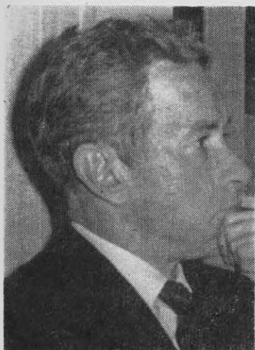
JUAN RULFO: contradictorio...

S IN pena ni gloria pasó por Chile el escritor mexicano Juan Rulfo, autor de los celebrados libros: El llano en llamas , cuentos; y Pedro Páramo , novela calificada por muchos como "eje del realismo mágico en la literatura latinoamericana".