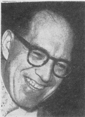
GERMAN ARCINIEGAS: al servicio de los poderosos.

(Obra de Germán Arciniegas representada por los enfermos de Cundinamarca).