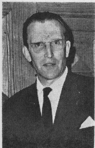
ANIKIN: seguridades a La Moneda

Se sabe que en más de una ocasión en Moscú se observó con cierta desazón el interés de La Moneda por dar mayor publicidad a acontecimientos que no se habían registrado. Fue el Gobierno democristiano el que hizo estallar con gran ruido la noticia de las negociaciones de cuatro convenios entre ambos países, en los momentos en que se efectuaba una reunión interamericana en Buenos Aires, pese a que existía compromiso de mantenerlo en reserva hasta que las con-