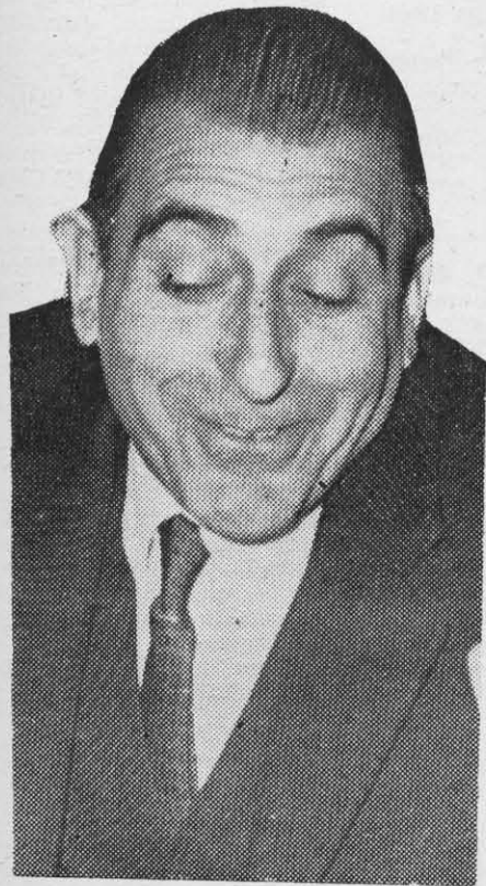
FREI: en busca de la otra "viga maestra".

PARA el Presidente Frei y su equipo de asesores y consejeros más íntimos, la Promoción Popular es, en orden de prelación el proyecto más importante del Gobierno después de los convenios del cobre. Prácticamente es la segunda "viga" sobre la cual se proyecta montar el andamiaje de un predominio político demócratacristiano para largos años. De ahí parte la bullanga armada por toda la maquinaria propagandística del régimen ante el rechazo por una comisión del Senado, de la idea de legislar sobre la materia. Bastante aporreado con los crujidos que acusa la "viga maestra" del cobre, es explicable que el Gobierno se alarme ante la idea de que la crujidera tienda a comprometer otras piezas de la estructura concebida para un largo pasar.