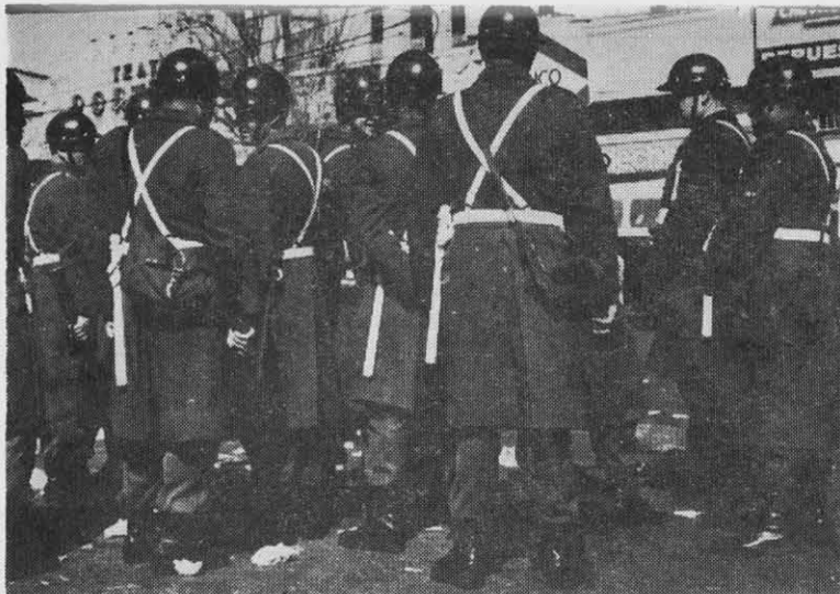
El símbolo del régimen.