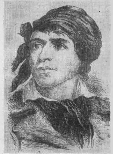
JEAN PAUL MARAT, dibujo de Rousseau.