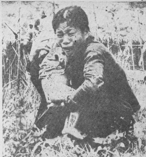
"Nuestros aviones no pueden equivocarse..."

Los pilotos me parece que no tienen ningún fanatismo político o guerrero. Aman sus máquinas y le tienen miedo a los cohetes