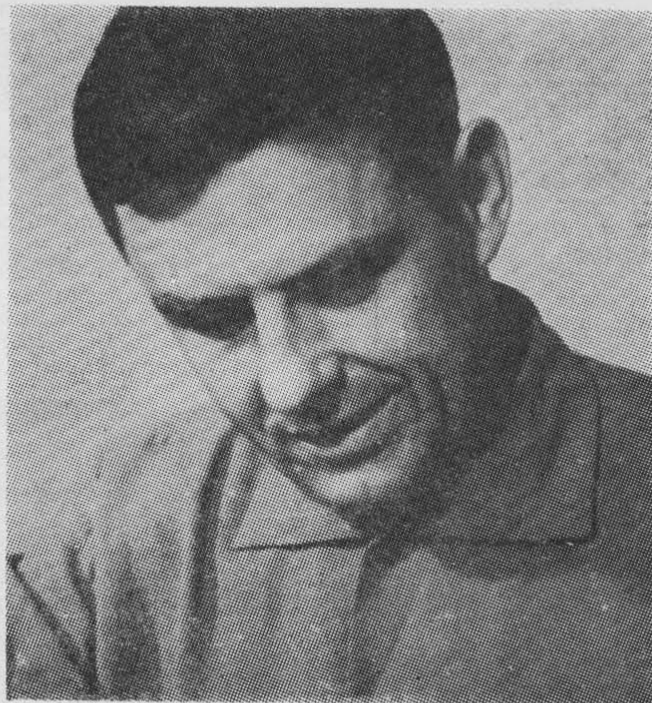
KOMAROV: un héroe de nuestro tiempo

El "Soyuz-I" era un tipo nuevo de vehículos espaciales ensayado por la URSS, y su éxito marcaría la entrada en acción de una generación absolutamente diferente de naves cósmicas. Komarov tenía todas las cualidades para dirigirlo: su formación de ingeniero, su experiencia de pi-