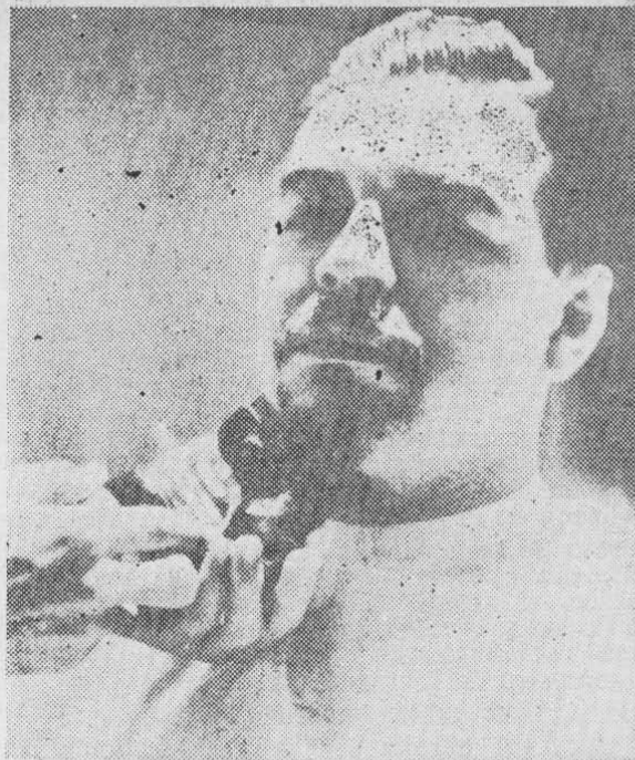
CHE: el hombre liberado y el liberador.

Este hombre pálido, de semblante doliente, que abandonó las filas de la marina de guerra para alistarse en las falanges del pueblo, con los campesinos y obreros contra los militares corrompidos, dejó el uniforme de los mercaderes de la patria para combatir por los débiles y los vencidos, transformándolos en poderosos y triunfantes. Ha sido para mí, cansado y lejos de la patria, un bien reconstituyente platicar más tarde con quien puedo