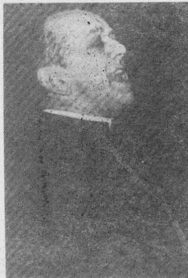
Arzobispo Cámara: pronosticó guerrillas.

Costa e Silva es distinto. Mientras Castello era austero como un monje trapense, Costa e Silva es un epicúreo al que encanta apostar en las carreras de caballos y beber buen cognac francés.