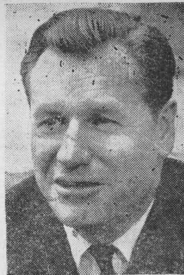
Nelson Rockefeller: guardián de la fortuna de Dios.