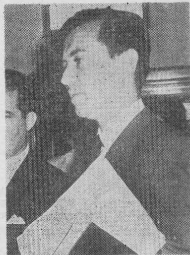
JUAN HAMILTON, Ministro de la Vivienda: crisis en su ramo.

Por otra parte, el lector carnet 671827, teléfono 44606 de Santiago, nos escribe sobre el mismo asunto. En 1955 compró una parcela en San Pedro. Estaba abandonada. La hizo producir y construyó casas para los obreros y una bodega. En los avalúos de