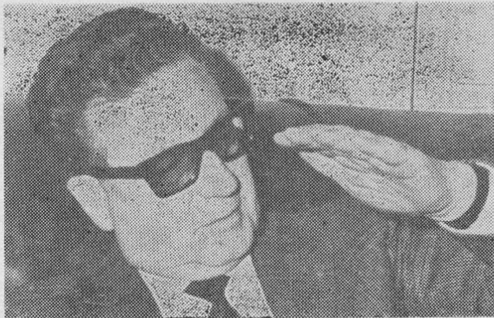
ALLENDE: su conferencia molestó a Frei

Al hacer el balance de la Alianza para el Progreso, Allende dio a conocer cifras elocuentes. Ese programa planteó una tasa mínima de crecimiento del 2,5%