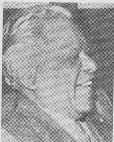
NICOLAS GUILLEN: primero la calidad...

Sin embargo, pega duro cuando se enfrenta a ciertos aspectos técnicos de aquella poesía. "No todos sus asuntos fueron felices y propios de su genio —escribe— ni se igualó con Píndaro cuantas veces se lo propuso... Suele ser verboso. Tiene versos repletos de adjetivos. Cae en los defectos propios de aquellos tiempos en que al sentimiento se decía sensibilidad. Hay en casi todas sus páginas versos débiles, desinencias cercanas, asonantes seguidos, expresiones descuidadas, acentos mal dispuestos, dip-tongos ásperos, alteraciones duras..."