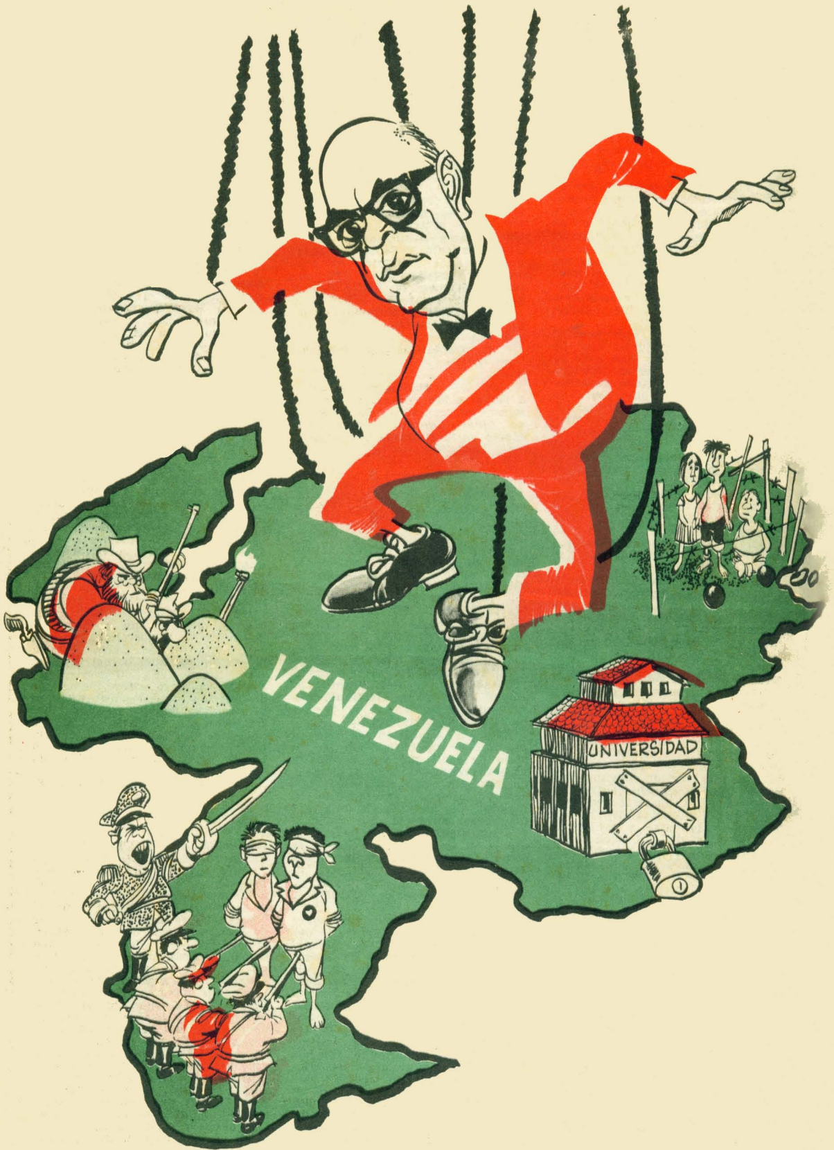
LEONI: ¡Socorro...! Fidel quiere destruir mi democracia...