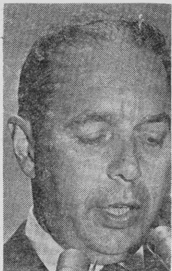
DUNGAN: El Virrey.

ternacional de Estados Unidos, estuvo recién en Chile por 48 horas, dando su aprobación a la forma cómo Chile usa los préstamos norteamericanos para atender su crucial problema de dólares".