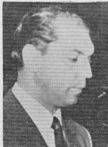
MOLINA: El fantasma de la recesión.

blemente. En la actualidad, el monto de impuestos declarados, pero no pagados, alcanza a 400 millones de escudos, a pesar de la fuerte campaña de fiscalización y cobro que existe. El rendimiento de la primera cuota de los impuestos a la renta fue inferior en 25 millones de escudos al cálculo primitivo del gobierno, lo que también fue un golpe duro para las esperanzas oficiales.