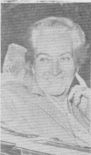
GABRIELA MISTRAL: Las clases de literatura.

ner por Víctor Domingo Silva, pero —en honor a la literatura— creemos que ha llegado el momento de (a fuerza de aparecer crueles: lo que importa son las generaciones futuras) suprimir de los libros de lectura su "Canto a la bandera". Lo mismo, el liricidismo titulado "Arturo Prat" (felizmente no alcanzamos a