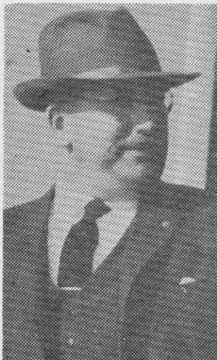
OELCKERS: Una policía super confidencial.

La Policía Política comenzó a ser reestructurada en cuanto la DC subió al poder. El nuevo partido de gobierno