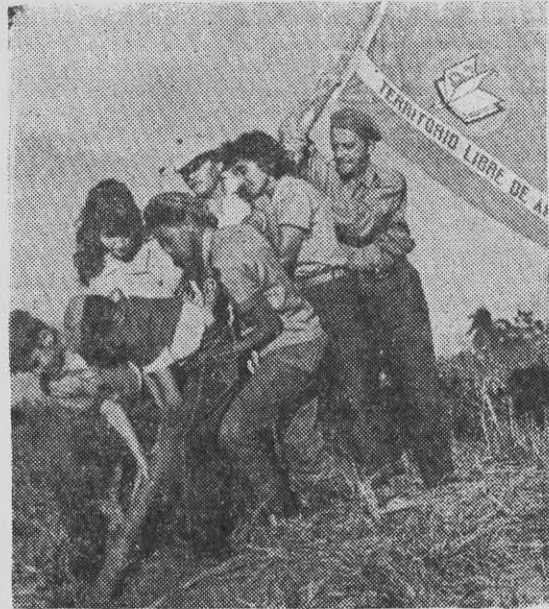
Cuba: realizaciones extraordinarias en la educación.

La lucha contra el vago, por ejemplo, era una tarea muy difícil años atrás, porque había una tierra de nadie inmensa que no se sabía qué era: si era vago, un medio vago o un vago y medio. Y en ese terreno medraban quienes rehuyendo del trabajo buscaban una ocupacioncita cualquiera, o un negocio cualquiera, ¡y de repente un joven con un bar, con un negocio ganando casi tanto como un piloto en el pasado, ochocientos, mil pesos! ¿En qué categoría conceptuar ese joven? ¿Medio vago? ¿Vago y medio? ¿Diez veces vago? Un vago come, un vago cuesta a la sociedad, un vago calza y viste, y consume de todo. Hace tanto daño como un vago improductivo que consume como diez vagos sin aportar a la sociedad absolutamente nada. O el caso, ¡asómbrense, señores!, de redes completas de sujetos destinados al juego prohibido, como en Oriente donde apareció una organización como de doscientos dedicados al juego ilícito, apoyándose en la lotería. ¡Doscientos! ¡Doscientos individuos!, que mientras decenas de miles se dedicaban a cortar caña para desarrollar la economía del país y a cumplir muy arduas tareas todos los días, que mientras miles de jóvenes en la Brigada Invasora trabajaban de día y de noche, incluso jugándose la vida en algunas ocasiones, expuestos a accidentes, enfrentándose al desbrozamiento de