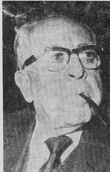
LUIS ALBERTO SANCHEZ: lo barrieron los estudiantes y trabajadores de San Marcos.

Respecto a la penetración imperialista, es obvio que Sánchez, por intermedio de su partido, era un agente de primer orden. Anticomunista profesional hoy, el senil ex-Rector debe estar disfrutando de las pingües ganancias acumuladas en tantos años de infamia y de desaguizados. Pero lo principal: ya no está en San Marcos. Y fue sacado por una acción de masas que ha demostrado, por primera vez —y seguramente que no será la última— su total eficacia.