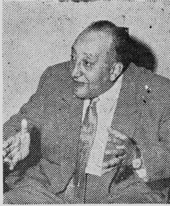
MIGUEL ANGEL ASTURIAS: embajador antiguerrillero, ¿a qué vendrá a Chile?

El antiguo John Dos Passos ha muerto hace mucho y su cadáver es el que rondó Chile.