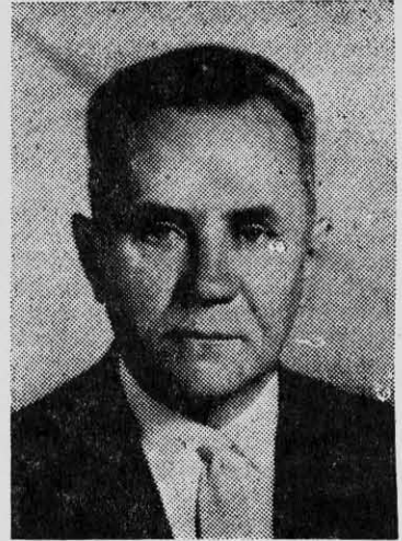
Kosigyn: política discutible

Los dirigentes de los partidos que se autocalifican vanguardias revolucionarias no pueden pensar que el pueblo les creará las condiciones objetivas para un estallido revolucionario. Este podrá contribuir a su precipitación pero tendrán que asumir los revolucionarios decididos el papel de detonantes y de guías de un proceso de liberación.