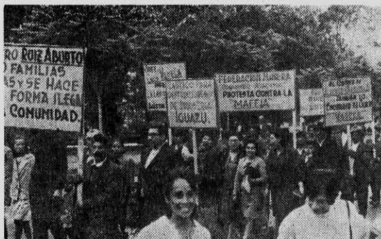
UNA MARCHA contra los jueces venales efectuó el pueblo de La Serena. La protesta provocó conmoción pública en el país. Hay querrelas del gobierno contra dos diarios de oposición.