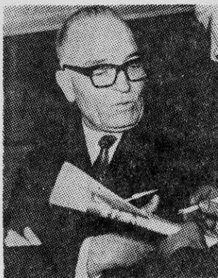
PEPE ZUJOVIC: los sindicatos en un puño.

Hasta esta ley, el Ejecutivo podía decretar la reanudación de faenas de acuerdo al artículo 626 del Código del Trabajo. Este artículo daba facultades al Presidente para que en los SEÑALADOS casos de ese artículo, se pusiera por