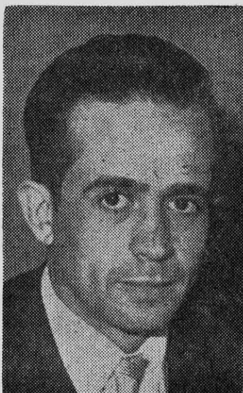
ZALDIVAR: no se haga el de las chacras.

El memorándum en referencia contiene 13 puntos que se refieren a la denuncia hecha contra Nun y German, por dos obreros de esa industria el 17 de octubre de 1968. Señala que la "citada empresa había sido notificada en el mes de julio de 1968 de que debía hacer abandono a beneficio fiscal de los excedentes (partes y piezas importadas de vehículos motorizados) ingresados indebidamente a