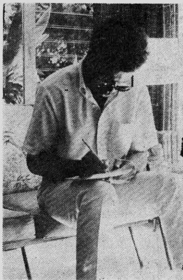
GEORGE MASON MURRAY: dirigente de los "Panteras Negras".

—Los imperialistas consideran que tienen derecho a acabar con la humanidad. Una prueba cabal de eso es lo que están haciendo contra el pueblo vietnamita, arrasando aldeas enteras, matando y quemando a cientos de miles de hombres, mujeres y niños. La prueba del imperialismo norteamericano es lo que llevaron a cabo en el Congo, donde los capitalistas del mundo, encabezados por el imperialismo norteamericano, asesinaron a más de un millón de congoleños entre 1960 y 1965. La prueba de su salvajismo son los miles de muertos, heridos y encarcelados que se registran entre la población negra de Estados Unidos, contra la que lanzan sus tropas, sus marines, su guardia nacional. Pero los pueblos del mundo van tomando conciencia de la bestia contra la que estamos luchando. Y nosotros hacemos un llamado a los pueblos de Asia, de Africa y de América latina, a tomar las armas para derrotar a los perros imperialistas. Hacemos un llamado para que si los imperialistas usan armas atómicas contra Vietnam, todo el mundo sea convertido en un Vietnam. Nosotros no depondremos las armas hasta que todos los pueblos del mundo alcancen su libera-