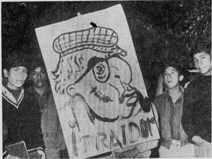
ASI VIERON los estudiantes peruanos al Rector de la Universidad de San Marcos y por eso lo sacaron.