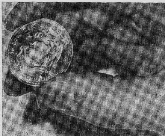
EN LA FOTO: una moneda de oro chilena. Gestores democristianos acuñarán miles de ellas por cuenta de una firma italiana.

Eso explicaría la enorme cantidad de oro que se pretende internar: cinco toneladas. Los coleccionistas estiman que este es otro aspecto muy sospechoso del negocio porque bastarían 170 kilos de oro para acuñar el número suficiente de monedas para el mer-